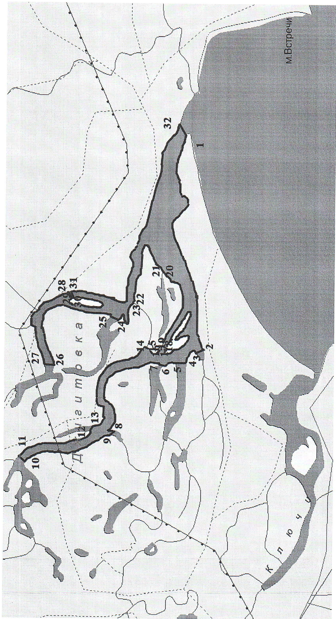
Схема границ рыбоводного участка на реке Ключи