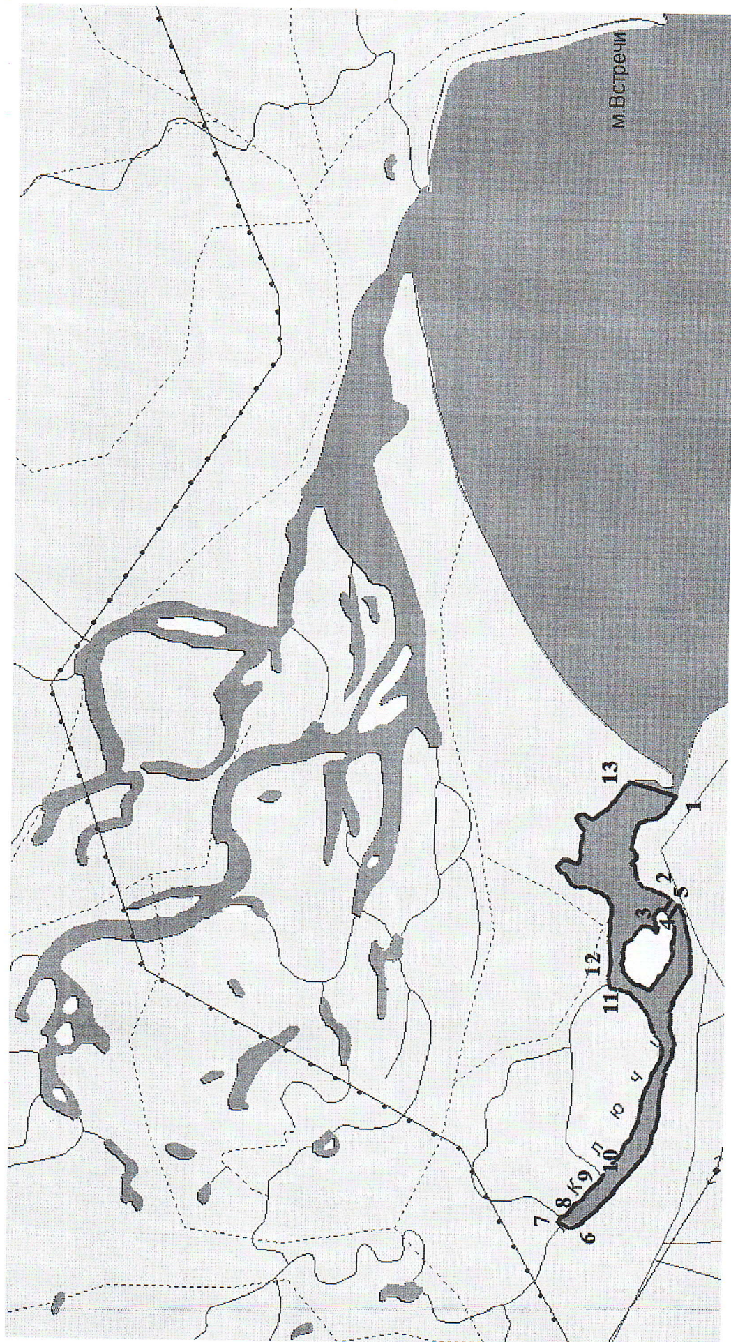
Схема границь рыбоводного участка на реке Ключи